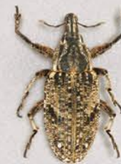
Буряковий довгоносик Asproparthenis punctiventris