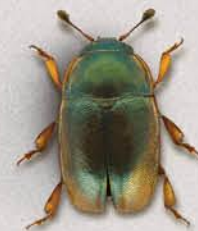
Квідоїд ріпаковий Meligethes aeneus