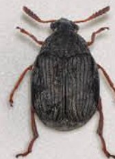
Горохова зернівка Bruchidius incarnatus