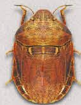
Шкідлива черепашка Eurygaster integriceps