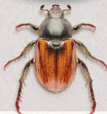
Хлібний жук Anisoplia austriaca