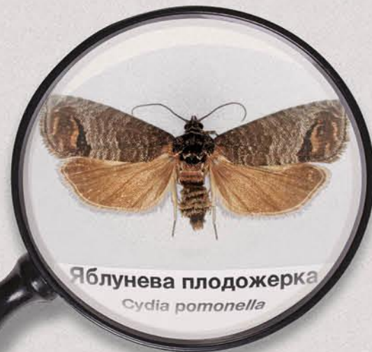
Яблунова плодожерка Cydia pomonella