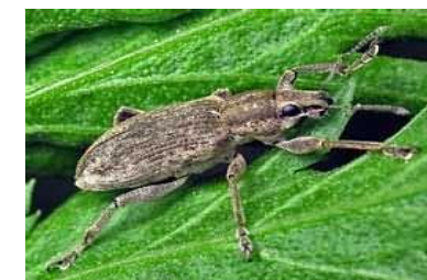
Звичайний буряковий довгоносик