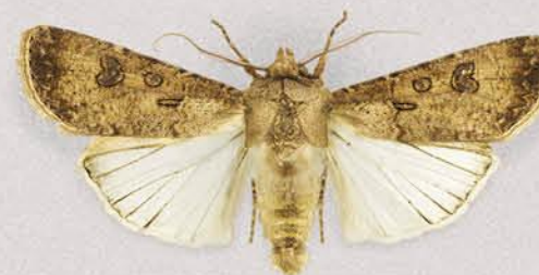
Совка озима Agrotis segetum