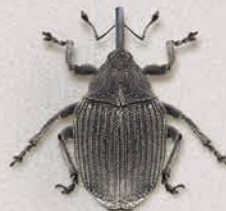
Прихованохоботник Ceutorhynchus napi