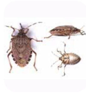
Kahverengi Kokarca ( Halyomorpha halys )