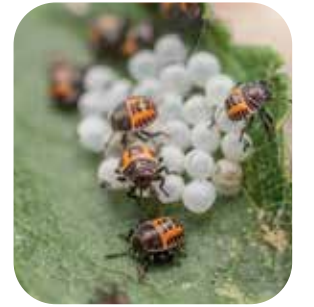
Yumurtadan çıkan Kahverengi Kokarca nimfleri