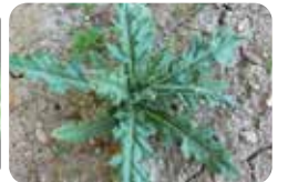
Köygöçüren ( Cirsium arvense )