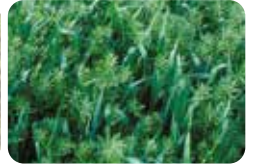
Yapışkan otu ( Galium aparine )