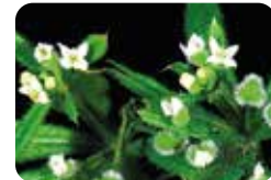
Kokar ot ( Bifora radians )