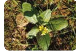
Yabani Hardal ( Sinapis arvensis )