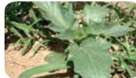
Şeytan elması ( Datura stramonium )