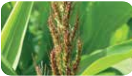
Darıcan ( Echinochloa crus-galli )

! Tüm topraktan etkili herbisitlerde olduğu gibi Alcance® 'den istenilen en iyi sonuçların alınabilmesi için iyi bir toprak işlemesi yapılmalıdır. Toprak tavında ve keseksiz olmalıdır. Uygulamalardan en iyi sonucu almak amacıyla yelpaze hüzmeli meme tercih edilmeli ve dekara 20-40 litre su ile ilaçlama yapılmalıdır.