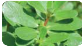
Semizotu ( Portulaca oleracea )