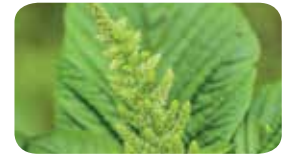
Kırmızı köklü tilki kuyruğu ( Amaranthus retroflexus )