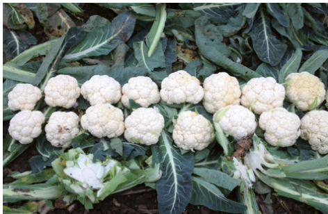
Verimark® ochrona przed szkodnikami

Poniższe zdjęcia z doświadczeń polowych pokazują różnice w jakości towaru wyprodukowanego z użyciem standardowego programu ochrony a programu ochrony bazującego na środkach zawierających substancję czynną Cyazypyr®. Doświadczenia wyraźnie pokazują, że stosowanie środka Verimark® przed wysadzeniem rozsady zdecydowanie wpływa na formowanie jednolitych, wyrównanych plonów spełniających wymagania sieci handlowych.