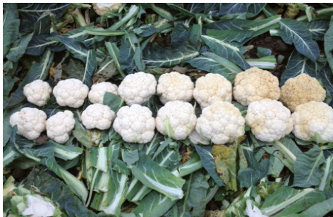
Standardowy program ochrony