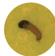
Išsiritusios lervos yra pažeidžiamos kontaktiniu būdu.