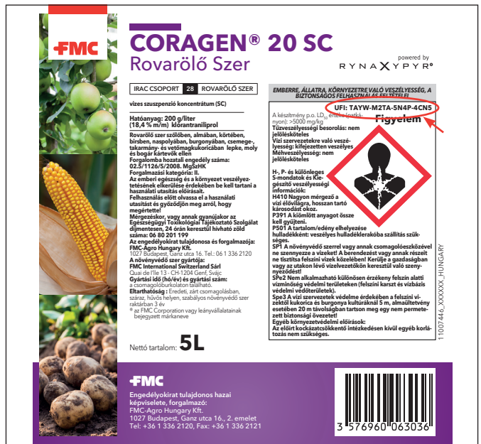
Példa FMC-Agro Hungary Kft. által forgalomba hozott rovarölő szer előlap címkén található UFI elhelyezésre