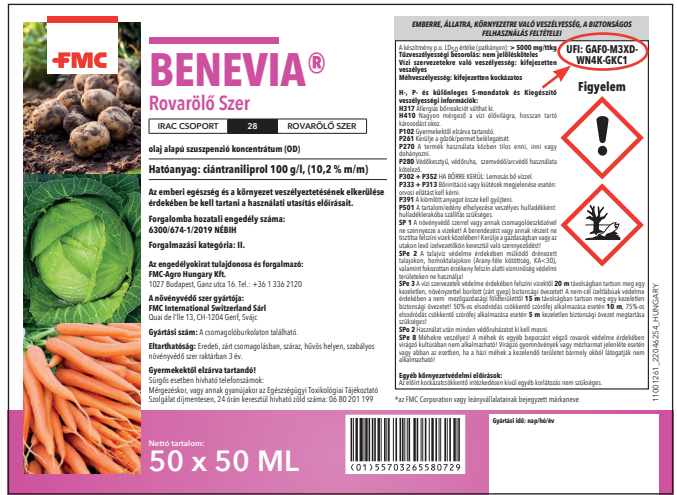
Példa FMC-Agro Hungary Kft. által forgalomba hozott rovarölő szer kartonon található UFI elhelyezésre

Fogyasztói felhasználásra szánt keverékek esetén a vállalatok 2020. január 1-jéig kötelesek bejelenteni az UFI-t és a többi termékinformációt az új harmonizált formátumban. Foglalkozásszerű felhasználásra szánt keverékek esetén 2021. január 1-jéig , a kizárólag ipari felhasználásra szánt keverékek esetén pedig 2024. január 1-jéig kell megtenni a bejelentést. A már forgalomba hozott keverékeknek az átmeneti időszak végéig, azaz 2025. január 1-jéig kell megfelelni az előírásoknak, vagyis addigra a forgalmazott összes érintett termék címkéjén fel kell tüntetni az UFI-t. A vállalatoknak a rájuk vonatkozó határidő előtt el kell készülniük a címkéken lévő UFI-val, hogy be tudják jelenteni ezeket a termékinformációkat a toxikológiai központokhoz. A gyakorlatban ez azt jelenti, hogy a vállalatnak az UFI létrehozását és a megfelelő termék címkéjén nyomtatását gondosan meg kell tervezni, és ezt a vonatkozó benyújtási határidők előtt – akár már a mai naptól – is megteheti.