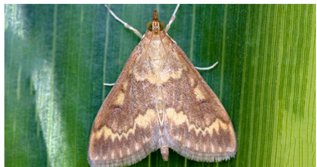
Adultes Tier (männlich)