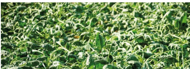
Kupfermangel an Zuckerrüben