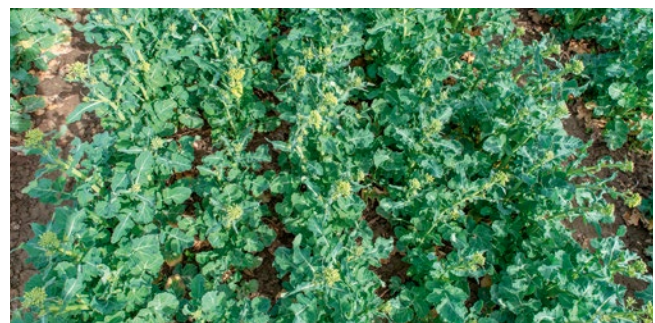
Gajus® 3 l/ha; gespritzt in BBCH 10-12 der Unkräuter