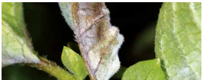
Phytophthora infestans , frische Blattinfektionen