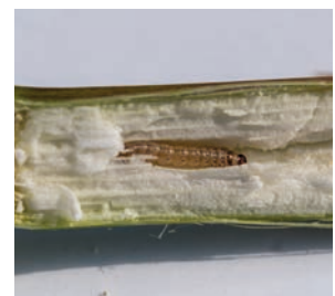
Nach Stadium 2 fressen Zünslerlarven im Inneren des Stängels abwärts.