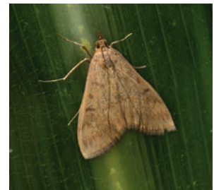
Die Maiszünsler legen ihre Eier auf der Blattunterseite ab.