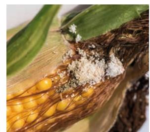
Die Zünslerlarven bohren sich auch in den Kolben ein. Dies kann zu Pilzbefall und erhöhten Mykotoxingehalten im Erntegut führen.